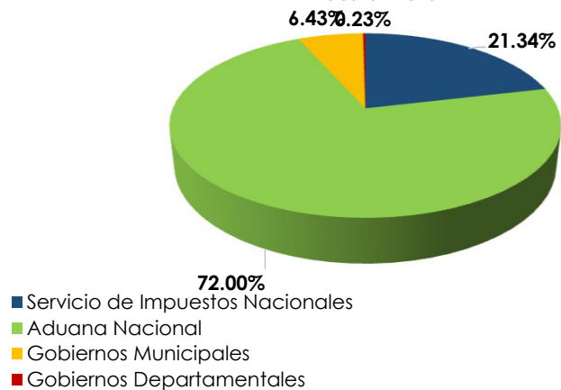
Recursos Jerárquicos Radicados según Administración Tributaria Según cantidad de Recursos Gestión 2020